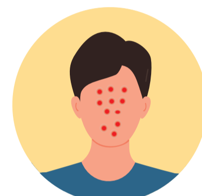
Erupcions a la cara