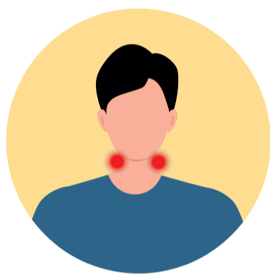
Inflamació dels ganglis limfàtics