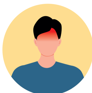
Mal de cap